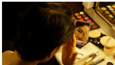
サイレン・チョン・ウニョン『変則のファンタジー_ 日本版』