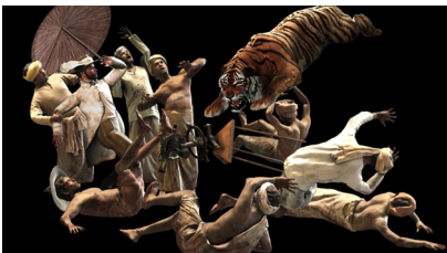
ホー・ツーニェン『一頭あるいは数頭のトラ』

多様なバックグラウンドのディレクターと協力して作られる公演プログラム「TPAM ディレクション」には、プロフェッショナルのための国際プラットフォームならではのスピード感で、アジアと世界の舞台芸術シーンの最新動向を反映する作品やプロジェクトが並びます。昨年は、タイの映画作家／美術家アピチャップン・ウィーラセタクン初の舞台作品『フィーバー・ルーム』が、一般のお客様の間でも大きな話題となりました。