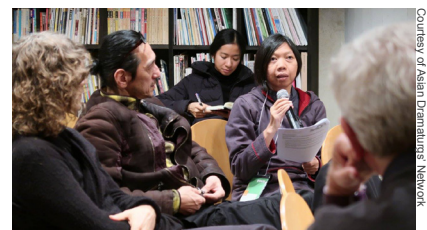
アジアン・ドラマトゥルク・ネットワーク・ミーティング (2017)

作品のプロモーション、情報交流、ネットワーキングの機会としてプロフェッショナルに活用されているプログラム「TPAM エクスチェンジ」。職業的な目的に特化した一部のミーティング以外は、一般のお客様にもご参加いただけます。2年連続での参加となるアジアン・ドラマトゥルク・ネットワークによる「ドラマトゥルギーと政治的なるもの」と題してのミーティング、舞台芸術制作者オープンネットワーク(ON-PAM)による公開シンポジウム、地域と共に活動する芸術文化の発展と成長をサポートするヨコハマアートサイト「アートサイトラウンジ」、TPAM ディレクション