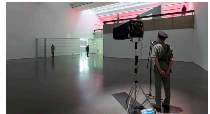
サムソン・ヤン『カノン』