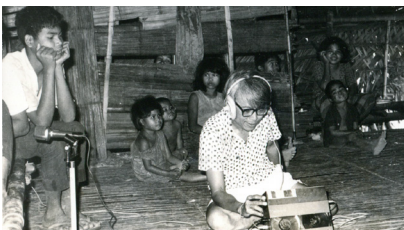
恩田晃・高橋悠治『ホセ・マセダについて』（対談）