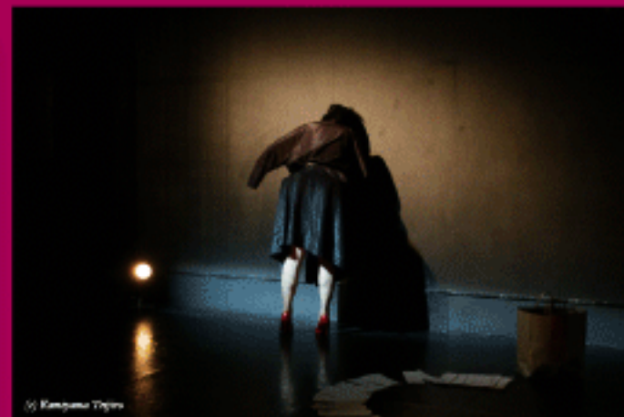
田村のん Tamura Non